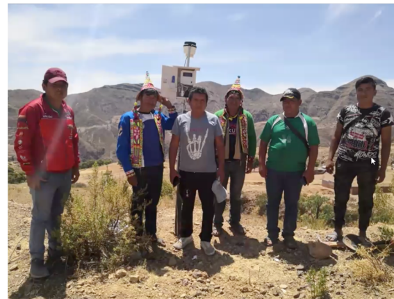
Meteorological stations in the Bolivian Andes