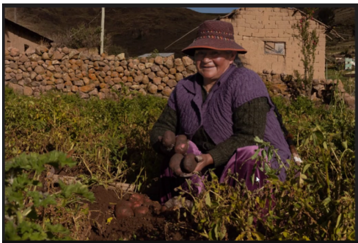
Farmer in the Bolivian Andes